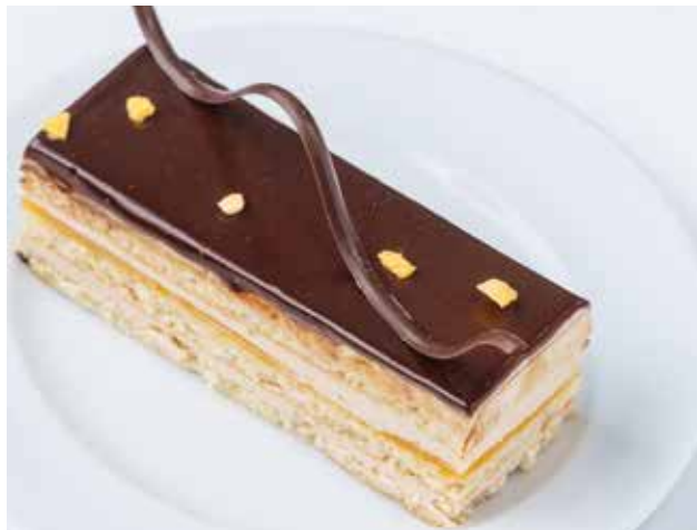
Опера с маракуйей 90гр 220 ₺

Яркое сочетание темного шоколада, маракуйи и лимонного бисквита