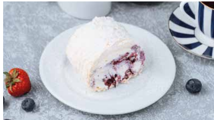
Рулет с кремом из маскарпоне и черникой 100гр 190 ₺