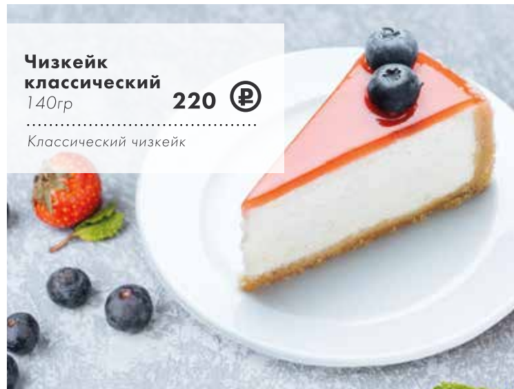
Чизкейк классический 140гр 220 ₺

Домашний сметанный торт из воздушных коржей