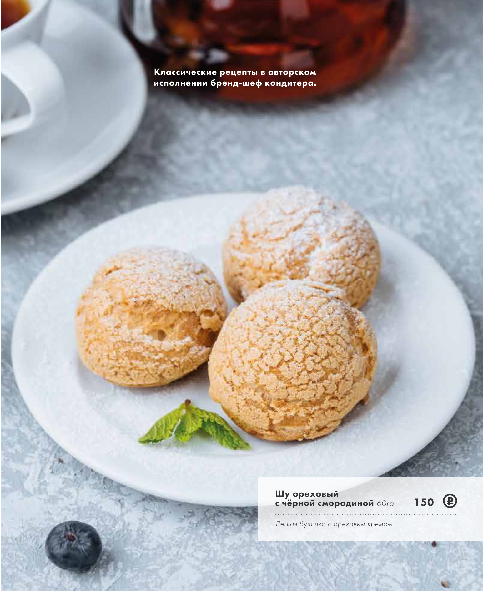
Шу ореховый с чёрной смородиной 60гр 150 ₺

Классические рецепты в авторском исполнении бренд-шеф кондитера.