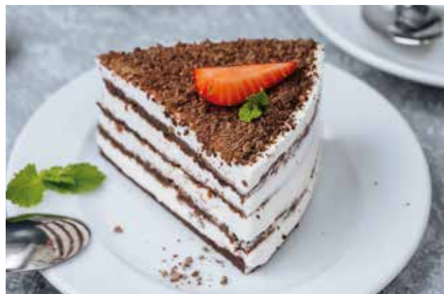
Сметанник 150гр 220 ₺

Воздушный десерт из сливочного сыра и клубники