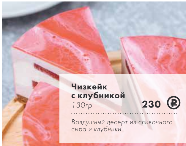
Чизкейк с клубникой 130гр 230 ₺

Яркое сочетание темного шоколада, маракуйи и лимонного бисквита