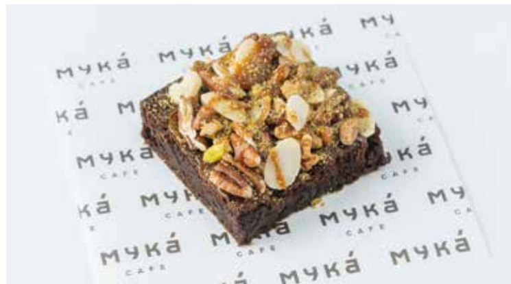
Брауни с солёной карамелью и орехами 100гр 250 ₺

Шоколадный десерт с орешками и соленой карамелью